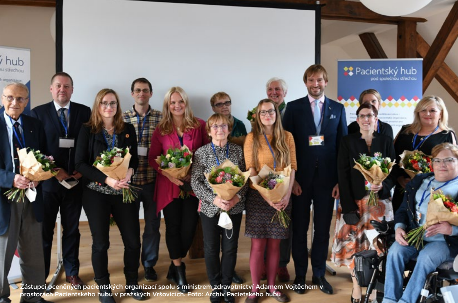
Zástupci oceněných pacientských organizací spolu s ministrem zdravotnictví Adamem Vojtěchem v prostorách Pacientského hubu v pražských Vršovicích.

da. Náš společný plán je, že by projekt převzaly neziskové organizace. A aby to bylo možné, je zapotřebí možnost financování – například právě probíhající malé grantové schéma, aby organizace utáhly nájem, měly zaměstnance a podobně. A snažili jsme se, aby to i nadále byl finančně udržitelný projekt. Jsme vděční městské části Praha 10, která nám pronajímá prostory za reálnou, ale dobrou cenu s vědomím, že je to veřejně prospěšný projekt. A podobně to bude i pokračovat, až projekt přejde do neziskového sektoru.