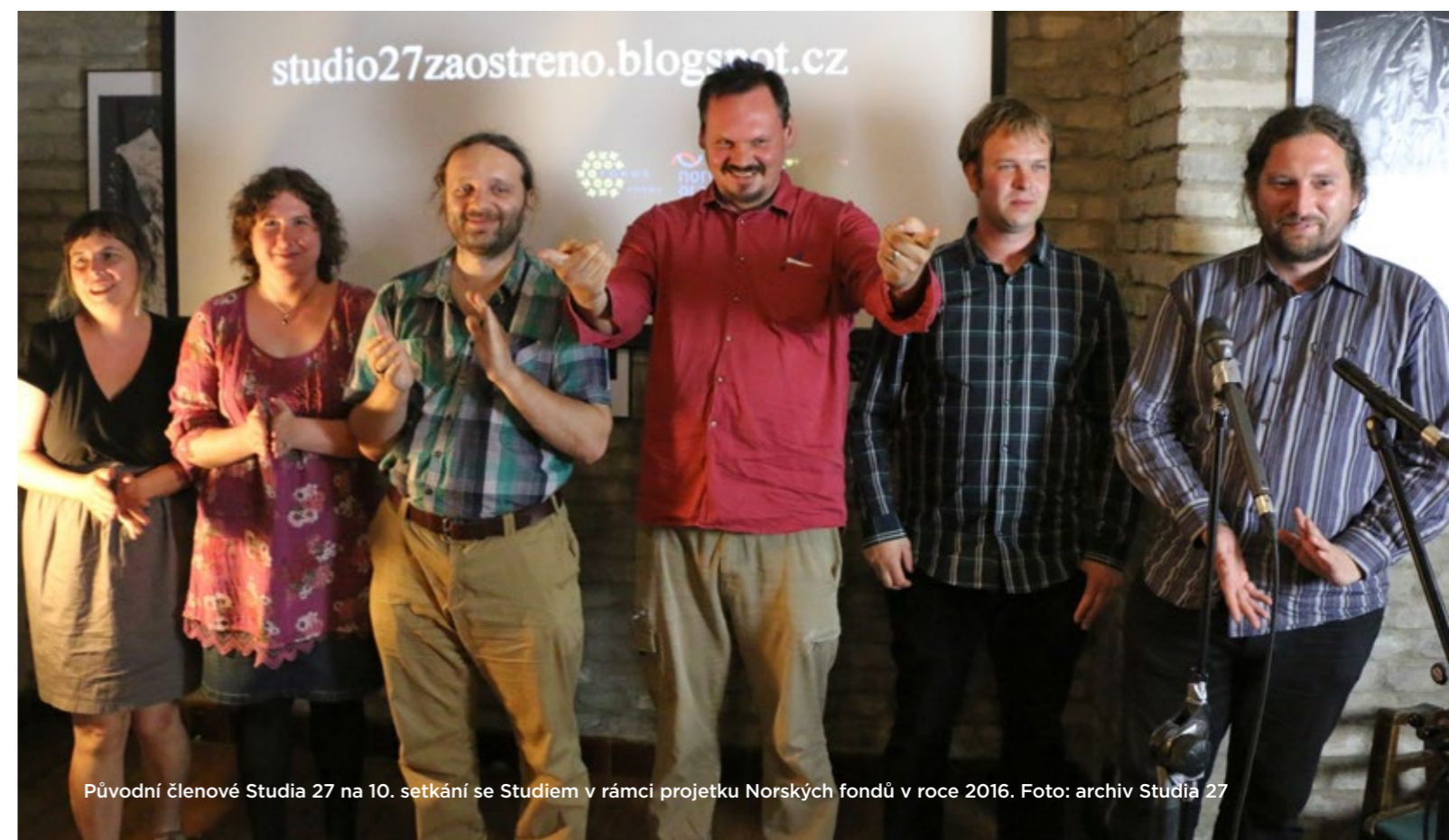
Původní členové Studia 27 na 10. setkání se Studiem v rámci projektu Norských fondů v roce 2016.

Michal: Nastoupil jsem v roce 1999 a v roce 2000 skončila pravidelná skupina.